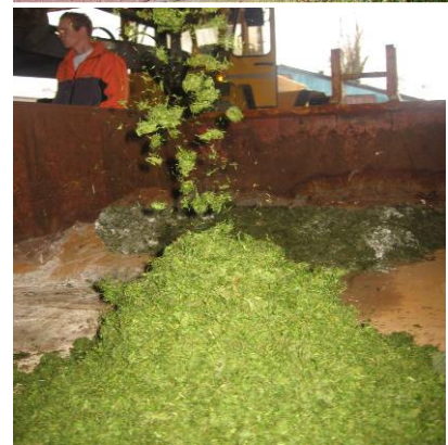
Van afval naar grondstof